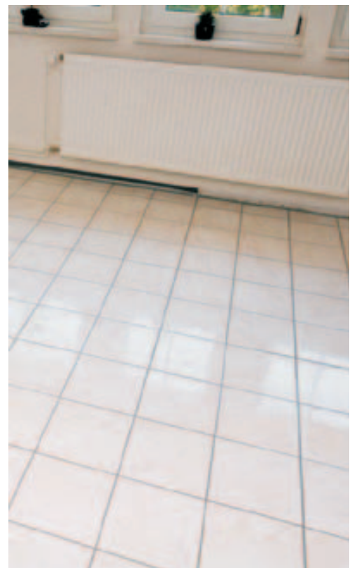
Dlažba položená pomocí MAPETEXU, vhodná k novému použití

Spárování okrajových styčných spár a průřezů spár nad konstrukčními spárami se provádí MAPESILEm AC , u dlažeb a obkladů z přírodního kamene MAPESILEm LM .