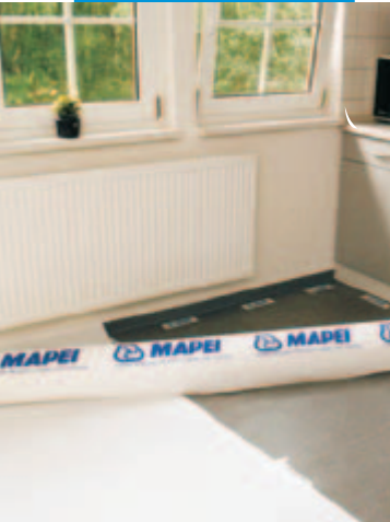
Použití MAPETEXu na vzorové výstavní dlažbě. Upevnění MAPETEXu na MAPETEXu-STRIP