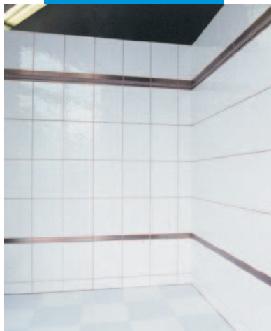
Plochy obložené novým obkladem; na dlažbu byl použit MAPETEX;