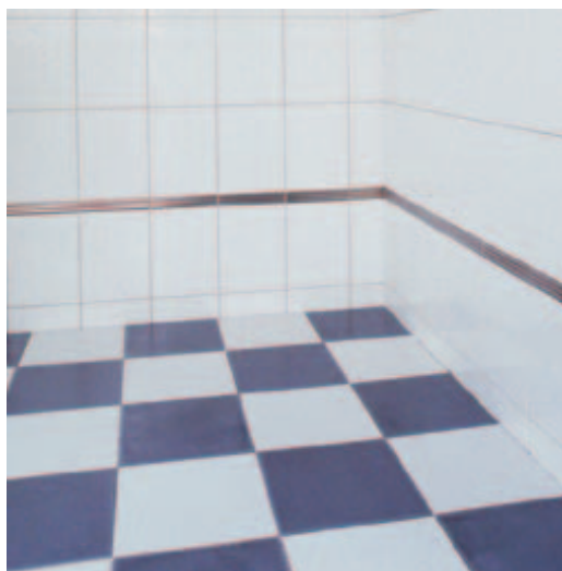
Dlažba položená pomocí KERQUICKu

Výše uvedené návody a předpisy vycházejí z našich nejlepších zkušeností a je nutno je dodržovat. Tyto návody považujeme však za indikativní a musí být potvrzeny praktickým použitím výrobku. Z toho důvodu doporučujeme předem posoudit vhodnost výrobku pro předpokládané použití. Uživatel přejímá plnou zodpovědnost za používání výrobku.