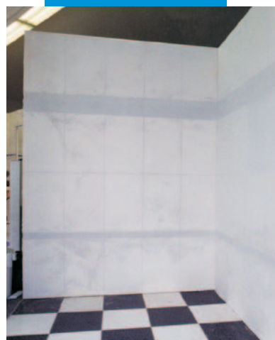
Upevnění MAPETEXu na MAPETEX-STRIP na stěně