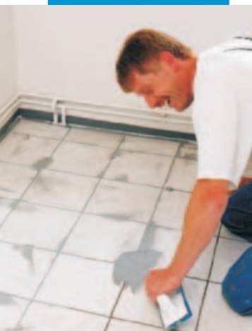
Spárování dlažby spárovací hmotou MAPEI