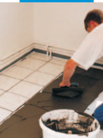
Pokládka keramické dlažby pomocí KERAQUICKu