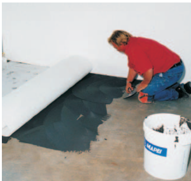
MAPETEX použitý k oddělení keramické dlažby na čerstvém betonu.