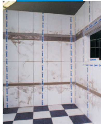
Renovace výstavní plochy; pokládka pomocí MAPETEXu-STRIP