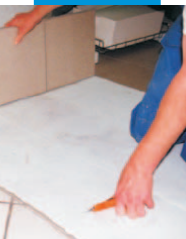
Řezání / lámání polí krytiny pro snadnější ohýbání