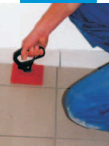
Zdvíhnutí dlažby pomocí přísavky